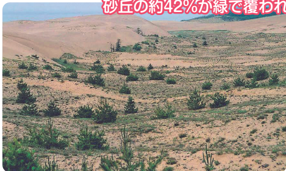
【平成3年の鳥取砂丘の状況】