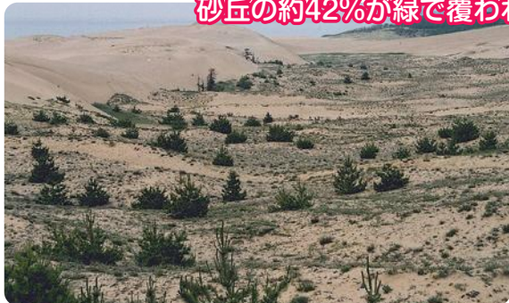
【平成3年の鳥取砂丘の状況】